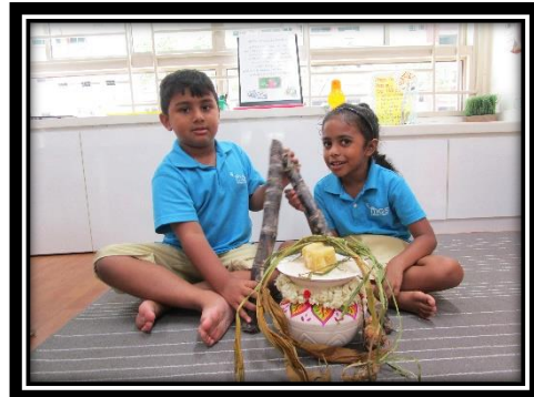
பிள்ளைகள் செய்த கைவினைப் பொருளைக் காட்சிக்கு வைத்தல்

14. பிள்ளைகள் வரைந்த ஓவியத்தை/செய்த கைவினைப் பொருளை வகுப்பறையில் காட்சிக்கு வைக்கவும்.