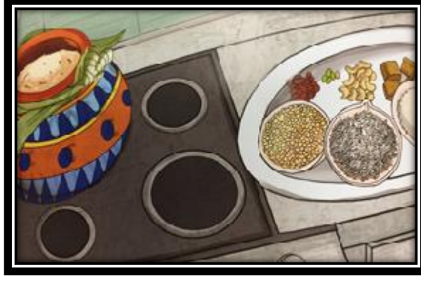
பொங்கல் செய்ய தேவையான பொருட்கள்

10. பிள்ளைகள் ஒவ்வொரு நிலையிலும் பார்த்துச் செய்வதற்குத் தேவையான மாதிரிகளைச் செய்து காட்டுங்கள்.